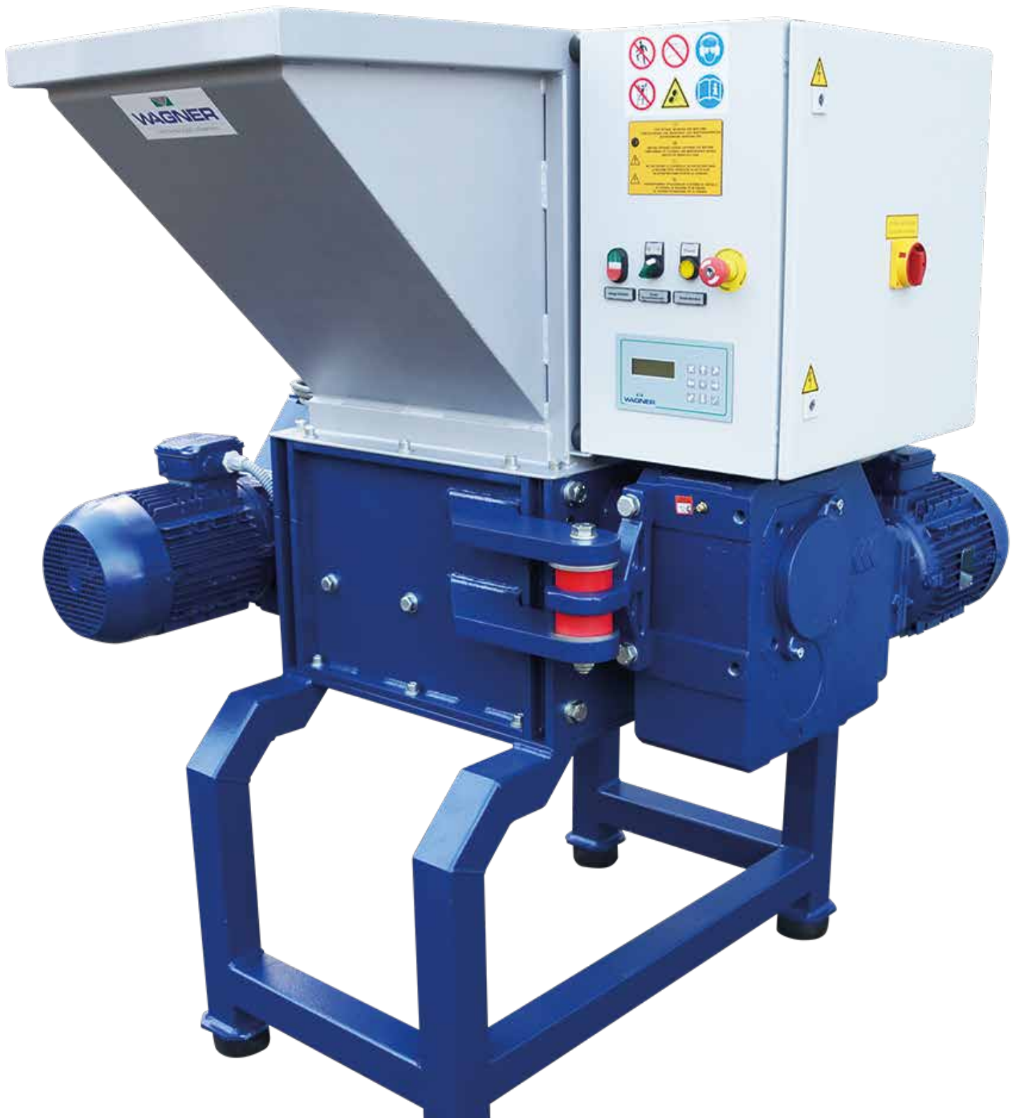
Wagner setzt zum Antrieb seines neuen Zweiwellen-Shredders WTS500 Getriebemotoren von Watt Drive ein